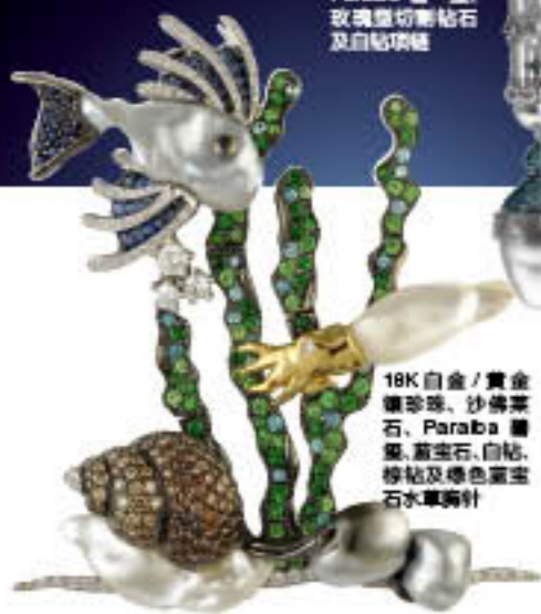
18K 白金 / 黄金 镶嵌珍珠、沙佛莱 石、Paraiba 碧 玺、蓝宝石、白钻、 绿钻及橙色蓝宝石 水草胸针

"My whole body is shaking and I found difficulty to talk for the first seconds! It's amazing!"