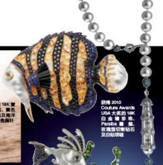
获得 2010 Couture Awards USA 大赏的 18K 白金镶嵌珍珠、 Paraiba 碧玺、 玫瑰型切割钻石 及白钻项链