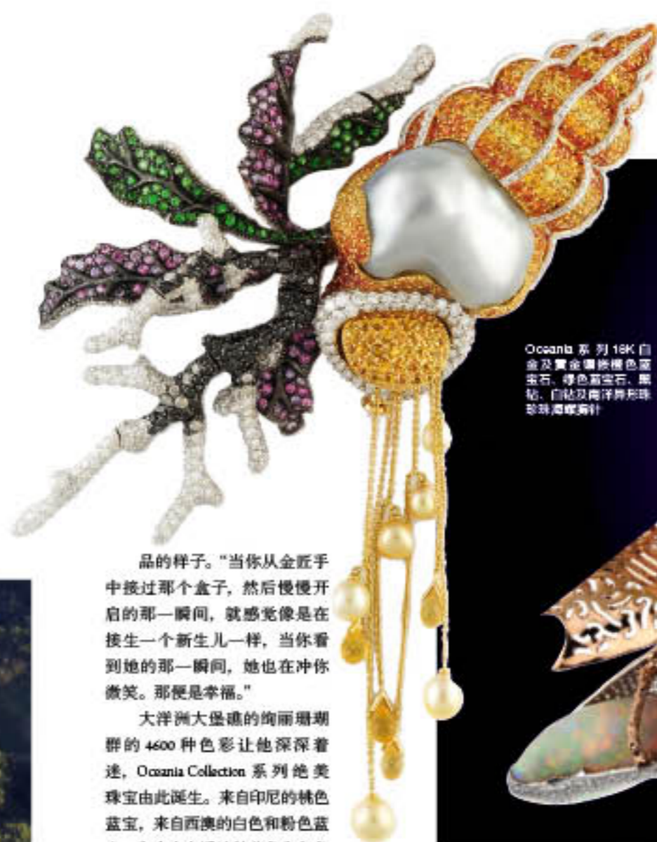
Oceania 系列 18K 白 金及黄金镶嵌彩色 蓝宝石、绿色蓝宝石、黑 钻、白钻及南洋异形珠 珍珠项链设计