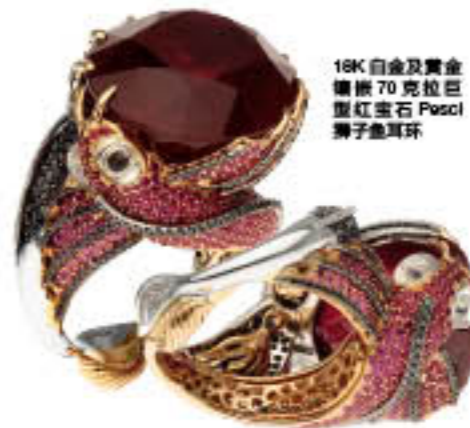
18K白金及黄金镶嵌70克拉巨型红宝石 Pasci 狮子鱼耳环