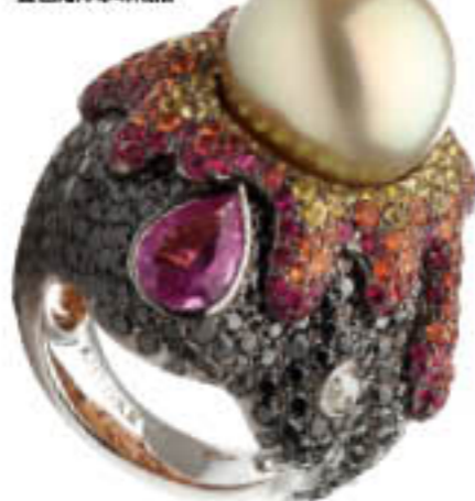
Fire and Ice 系列 18K 金 镶嵌钻石、彩色蓝宝石及 金色南洋珍珠戒指

震撼。在这里的时光让 Alessio 的生活充满了新 鲜气息，他坦言，在这片祥和自由的土地上他 得到了心灵的升华和艺术潜力的进一步激发。 几年前他更选择在这个被他称为圣地的小村上 买了一栋老房子。房子被一个古老的葡萄酒庄 园和层层黑色松露紧密环抱着，恍若世外仙 境。在这里年轻的艺术家开始了全新的艺术创 造旅程。他有时候也会喜欢重新欣赏自己早期 的作品，并和现在的作品进行对比，从中找到 自己的发展和进步。审视过去那些小石头和金 属制成的粗糙作品仍旧提醒着他什么才是设计 的真正本质。