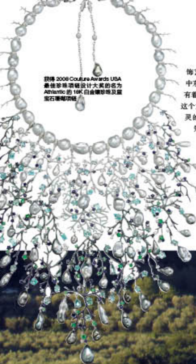
获得 2008 Couture Awards USA 最佳珍珠项链设计大奖的名为 Atlantic 的 18K 白金镶珍珠及蓝宝石珊瑚项链

饰艺术家并深深地热爱着东方艺术和 中东行为艺术，在很多方面都与 Alessio 有着非常愉快的交流。一次偶然的机会 这个女人的话给了年轻的 Alessio 一道心 灵的出口：“去旅行吧，在旅程中你会 知道自己想要什么，什么是你真正所 热爱的。”