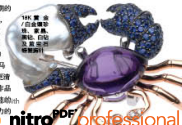
18K 黄金 / 白金镶嵌珍珠、黑钻、白钻及蓝宝石 螃蟹胸针

Alessio 热爱着植根于不同历史时期的 文化背景，希腊罗马的神话故事， 文艺复兴的伟大创造，巴洛克的 经典重现都让他爱不释手。每当人们问 起从何而来的无限动能时，他总将自己的 天才创造力归功于自己作为深受希腊和罗马 历史文化烙印下的意大利人的 DNA，而他更清 楚，对艺术原创精神的绝对忠诚使他的作品 总是那样的令人惊喜，卓尔不凡。对纯粹的 珠宝设计世界的追求，是他永葆创作动力的 坚实保证。而这位珠宝