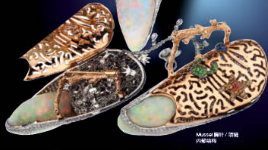
Mussel 设计 / 项链 内部结构

蓝宝石在 Alessio 精妙的设计重组下诞生的海洋 系列手环呈现浓缩世界的超凡美态。令人震 惊的还有出自同一系列的宝石蟹胸针。在这 款作品的设计上淋漓尽致地表现出了 Alessio 对大 自然的无限热爱。他像是一个永远活在自由 当中的顽童，将单纯的好奇心用最生动的视 角慷慨地展现出来。他奇妙地采用超过 25 毫米直径的 Silver South Sea 南海珍珠，加以 激光焊接的 50 个不同零件，使整件作品能够 像真正的螃蟹一样灵活运动，仿若真正的蚌 蟹般奇趣盎然。他总是带着一双孩童般的眼 睛，抛弃所有恐惧和约束，尽情地享受生命 里的动人场景，然后用最震撼的艺术闪光进 发出耀眼的火花。他创作的那件拥有 5000 多 个分支精密构成的 Atlantic 项链，将蓝宝和 珍珠的完美组合，展现出深海珊瑚灵动的姿 态，当你仔细欣赏这件精美绝伦的艺术品时， 仿佛能体会到人鱼公主穿行海底的唯美浪漫 场景。而这款作品更一举夺得 2008 Couture Awards USA 最佳珍珠项链设计大奖。2010 年，