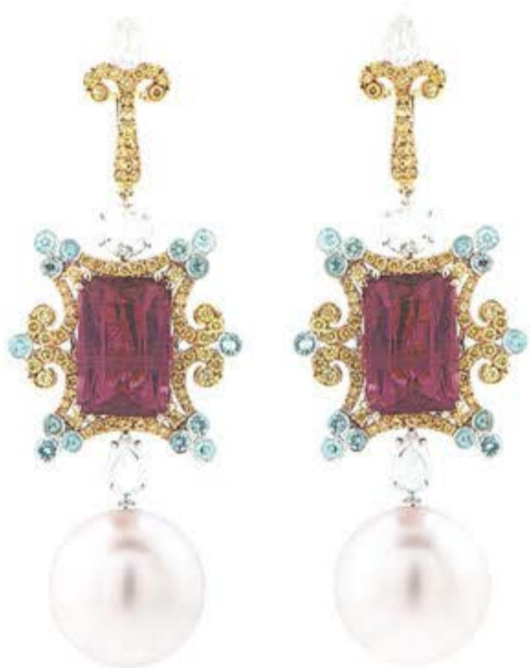
Серьги из желтого золота с рубеллитами, жемчугом, турмалинами и бриллиантами