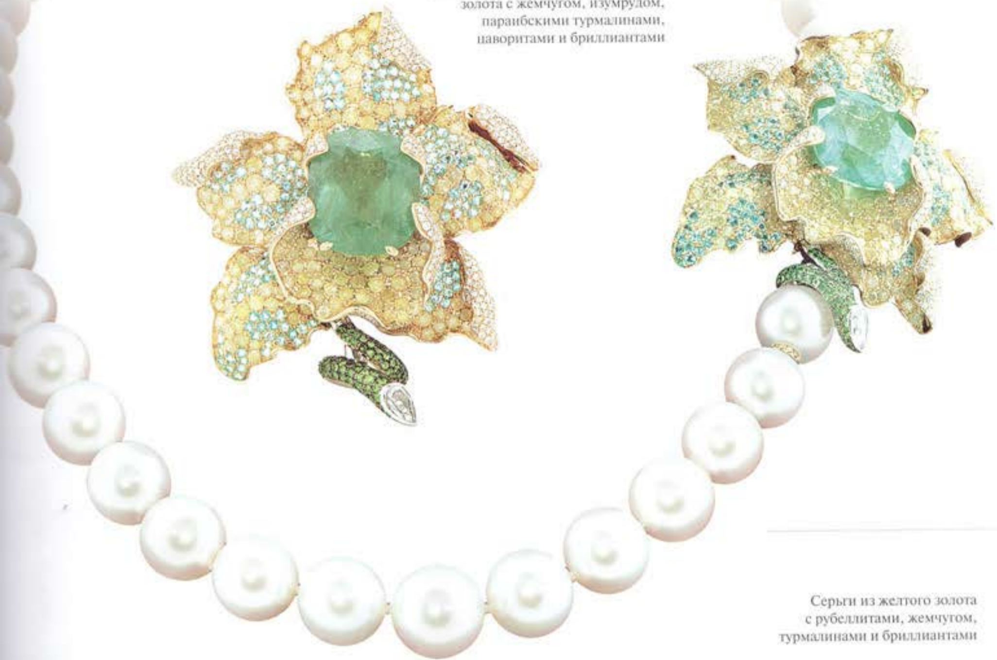
Серьги из желтого золота с рубеллитами, жемчугом, турмалинами и бриллиантами