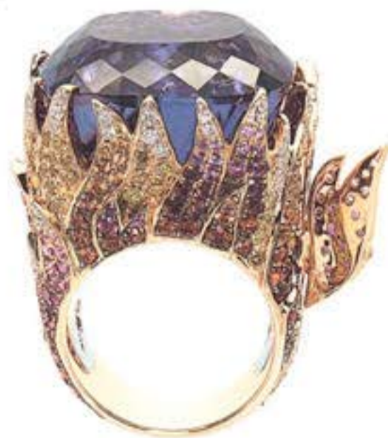
Кольцо из розового и белого золота с аметистом, сапфирами и бриллиантами