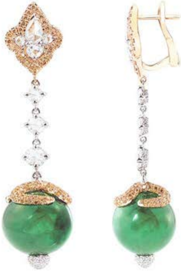
Серьги из белого и желтого золота с изумрудами и белыми и желтыми бриллиантами