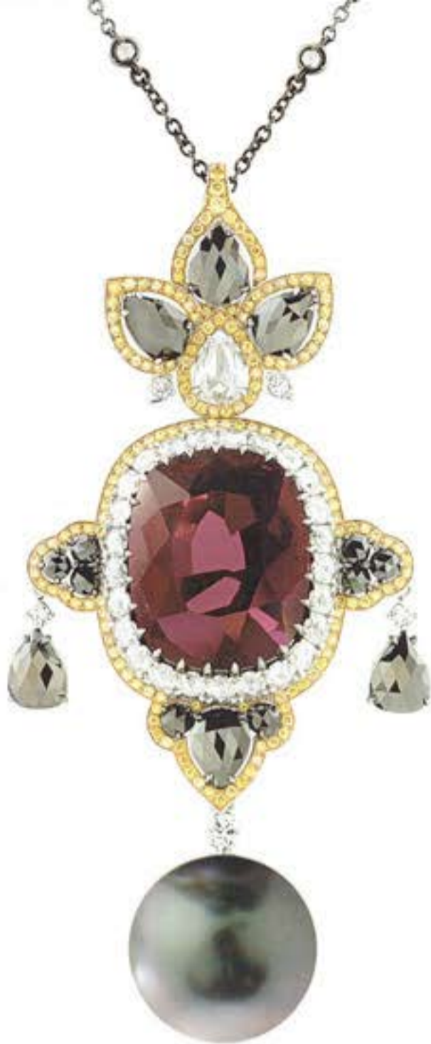
Подвеска из белого и желтого золота с рубеллитом, жемчугом, черными и белыми бриллиантами