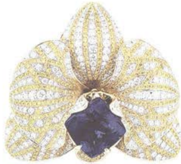
Брошь-застежка из белого и желтого золота с танзанитом и бриллиантами