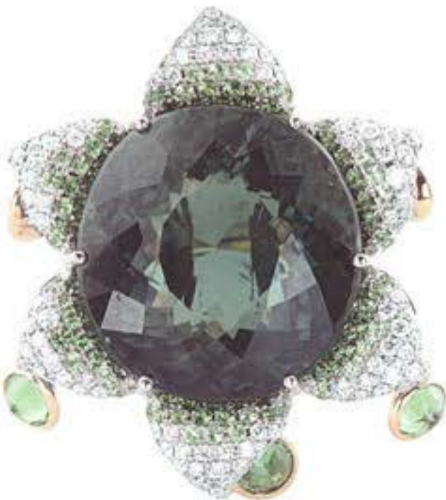
Кольцо из белого и желтого золота с турмалинами, сафирами и бриллиантами