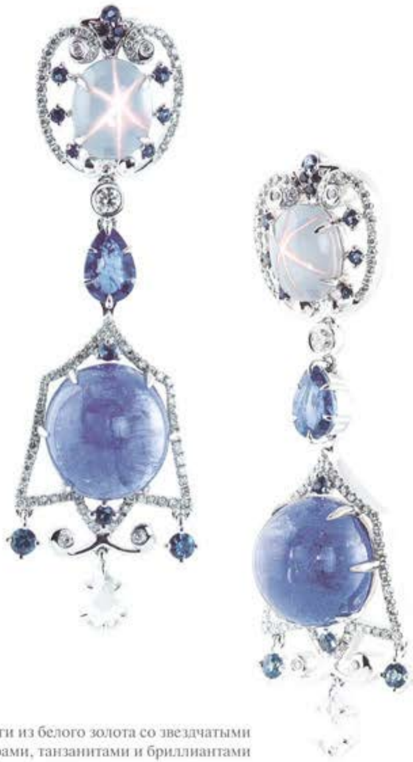
Серьги из белого золота со звездчатыми сафирами, танзанитами и бриллиантами