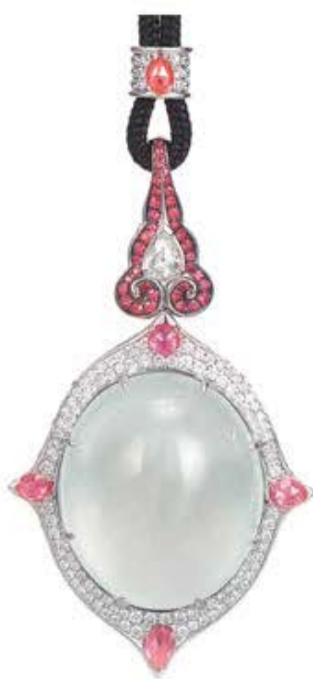
Колье THE SOFT RU-YI из белого золота с белым жадитом, розовыми сапфирами и бриллиантами