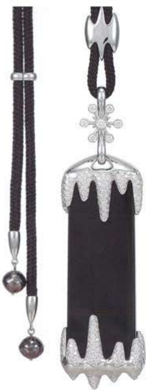
Колье THE BLACK WINTER из белого золота с черным жадеитом и бриллиантами