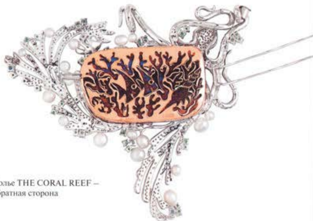
Колье THE CORAL REEF – обратная сторона