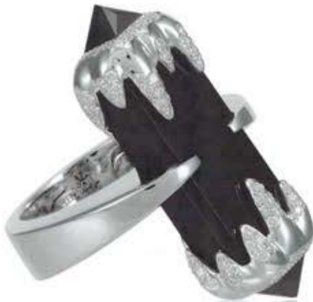
Кольцо THE BLACK WINTER с черным жадитом и бриллиантами