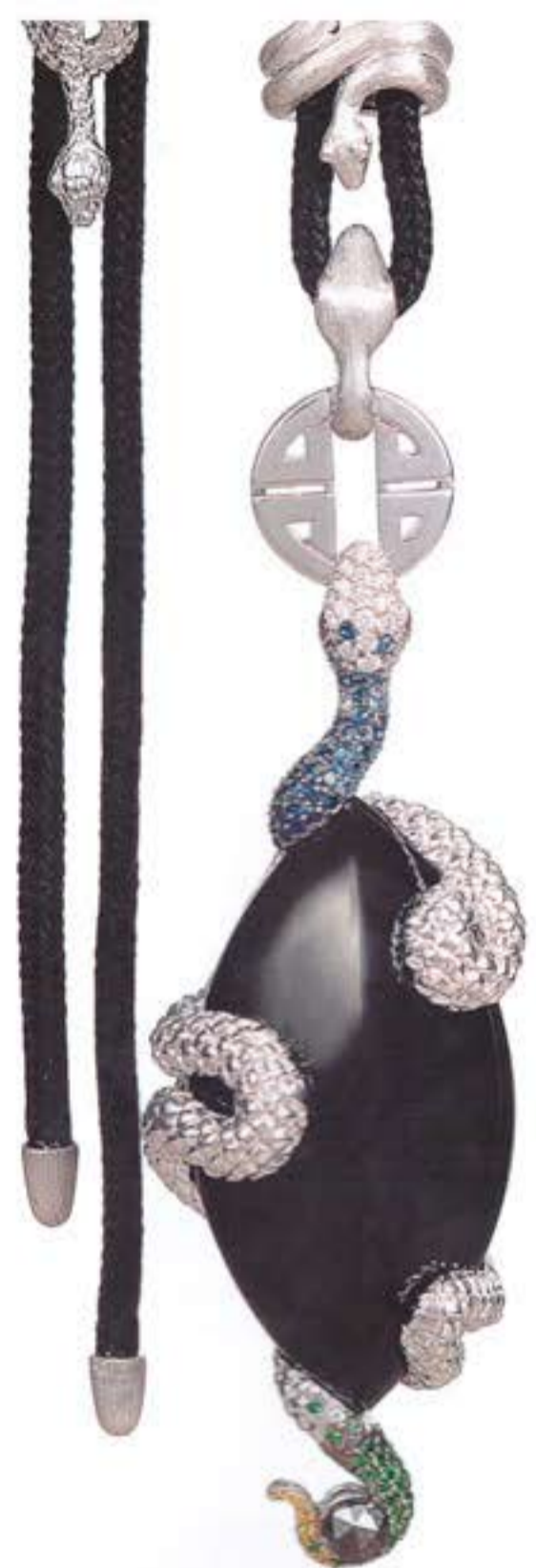
Колье THE VIPER из белого золота с черным жадитом, сапфирами, шаворитами и бриллиантами