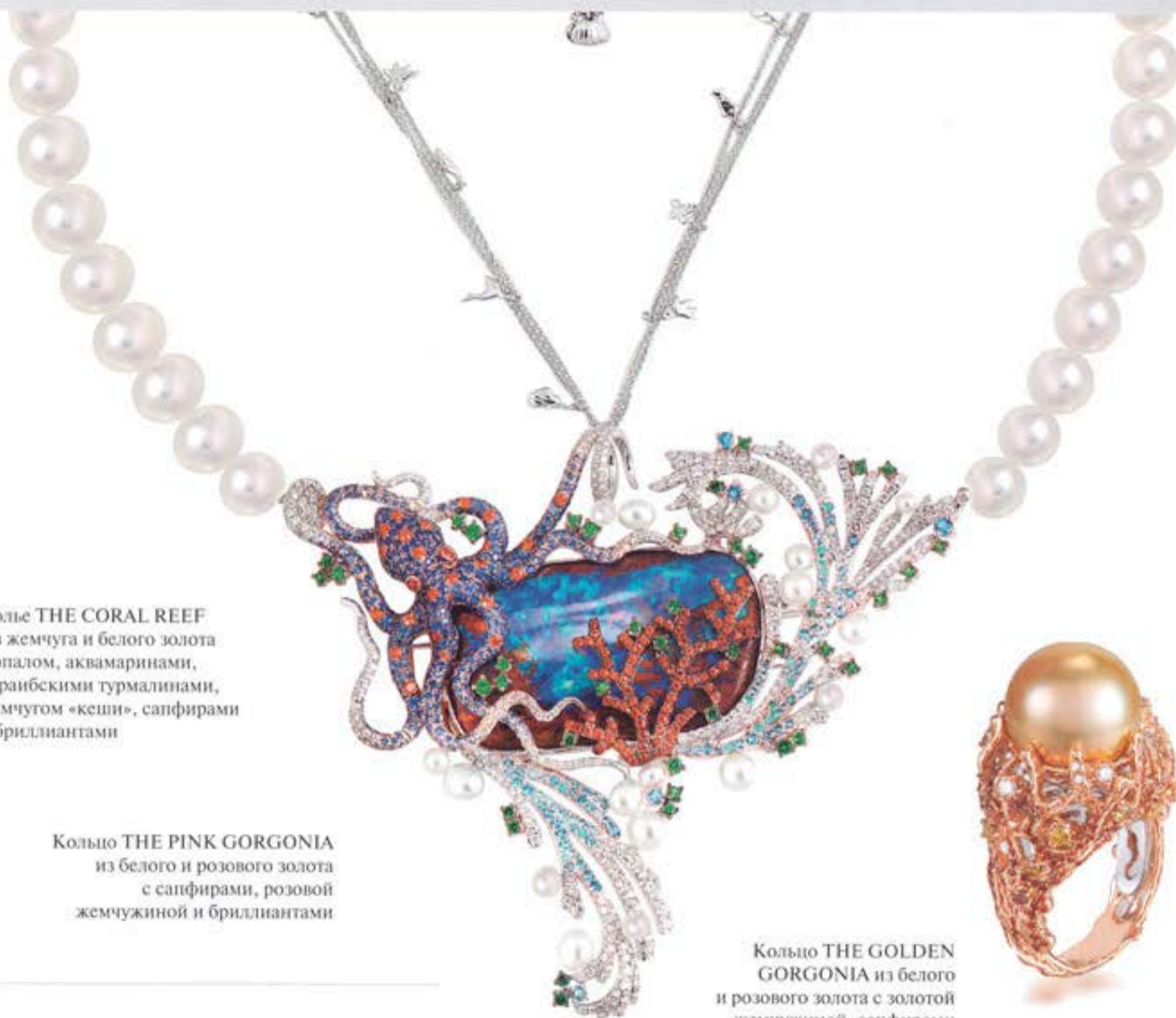
Колье THE CORAL REEF из жемчуга и белого золота с опалом, аквамаринами, параибскими турмалинами, жемчугом «кеши», сапфирами и бриллиантами