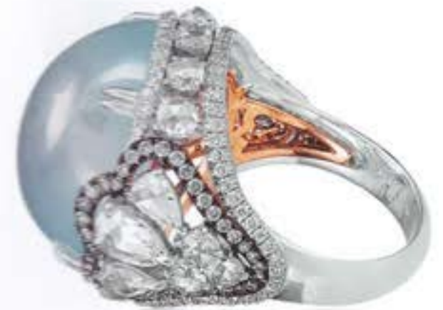
Кольцо GODDESS OF MERCY из белого золота с белым жадитом и розовыми и белыми бриллиантами