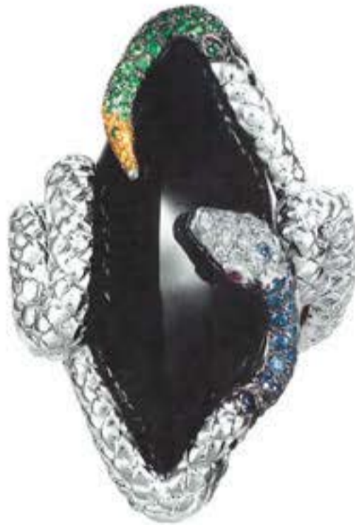
Кольцо THE VIPER из белого золота с черным жадитом, сапфирами, шаворитами и бриллиантами