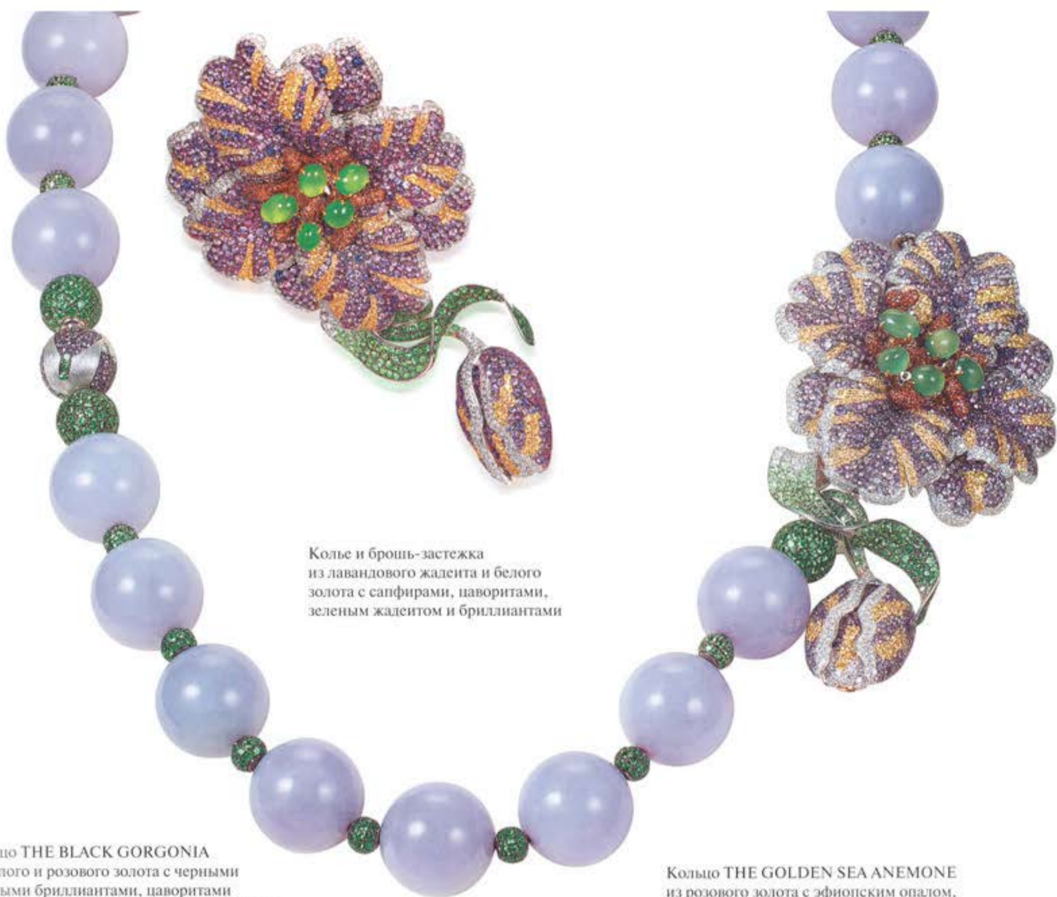
Колье и брошь-застежка из лавандового жадеита и белого золота с сафирами, цаворитами, зеленым жадеитом и бриллиантами