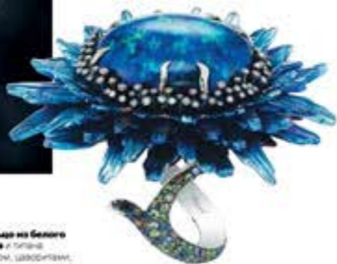
→ Кольцо на белом металле с опалом, сапфирами, цаворитами и бриллиантами

Компания Chopard в своей новой капсульной высокой коллекции обратилась к самому модному камню последних лет — опалу. В первых трех кольцах коллекции использованы черные австралийские опалы, причем самые драгоценные его разновидности, в которых видны не только синие и зеленые, но и красные и желтые сполохи. Как будто красота самок камней недостаточно, Chopard щедро напугает таинственности и магии. И зря — опалы настолько