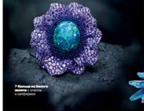
→ Кольцо на белом металле с опалом и сапфирами