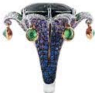
→ Кольцо на белом и желтом металле с турмалином, цаворитами, сапфирами и бриллиантами