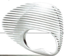
Кольцо из серебра. Zaha Hadid для Georg Jensen

бриллиант в пять карат за 800 долларов. И никак не хотела вскрикнуть в невозможность этого.