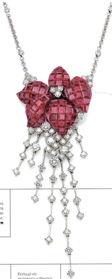
Подвеска из белого золота с рубинами и бриллиантами, Stenzhorn

Другой способ удешевления производства — тоненькие украшения из палочек и цепочек. Их на выставке великое множество, выглядят они все одинаково. И, насколько я понимаю, успех их сомнителен — деньги за них все равно надо отдать немалые, а выглядят они гораздо дешевле, чем стоят. Никому не нужны кисточки из цепочек за непомерную цену.