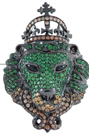
Кольцо из черного золота с цаворитами и бриллиантами. Lydia Courteille