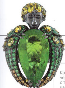
Кольцо из черного золота с турмалином, цаворитами, сапфирами и бриллиантами. Lydia Courteille