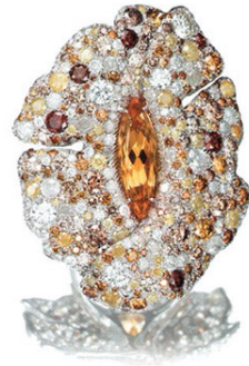
Кольцо из белого золота с бериллом и цветными бриллиантами, Palmiero Jewellery Design