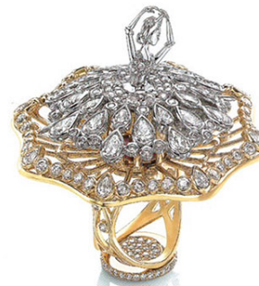
Кольцо из белого и желтого золота с бриллиантами. Sybarite

В первом, самом парфюмном павильоне, где собрались большие марки часов и украшений, шумно и часто слышна русская речь — соотечественники по-прежнему охочи до брендов. Во втором павильоне — тишина. Там выставлены украшения (правда, часы откусывают все больше пространства с каждым годом и поселились уже и там, где всегда были ювелирные вещи). Речь слышна в основном итальянская — не в силах смириться с утраченной мировой господства в области ювелир-