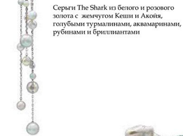
Серьги The Shark из белого и розового золота с жемчугом Кеша и Акойя, голубыми турмалинами, аквамаринами, рубинами и бриллиантами