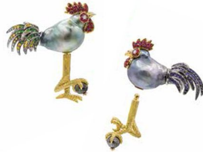
Запонки Rooster из желтого золота с барочным таитянским жемчугом, голубыми и цветными сапфирами, рубинами и цавритами, бесцветными и черными бриллиантами