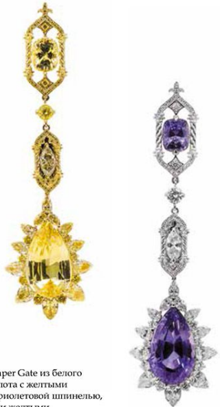
Серьги The Paper Gate из белого и розового золота с желтыми сапфирами, фиолетовой шпинелью, бесцветными и желтыми бриллиантами