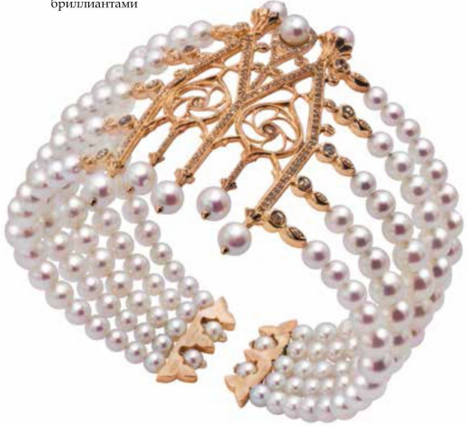
Браслет-манжета Glass Pinnacles из желтого золота и титана с белым жемчугом Акойя и коричневыми бриллиантами