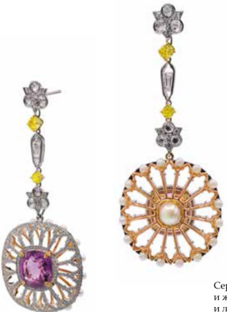
Серьги The Rosone из белого и желтого золота с фиолетовой и лилово-розовой шпинелью и розовым жемчугом Акойя, желтыми и бесцветными бриллиантами