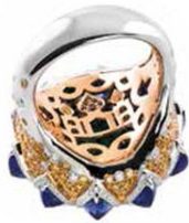
Кольцо The Star of Taj из белого и розового золота с замбийским изумрудом, синими сапфирами, с бесцветными, желтыми и черными бриллиантами