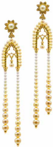
Гарнитур The Choir Window из коллекции Milano: кольцо, серьги, кольцо и браслет из желтого золота с желтым жемчугом Акойя, бесцветными и желтыми бриллиантами, колье – с золотым жемчугом Южных морей