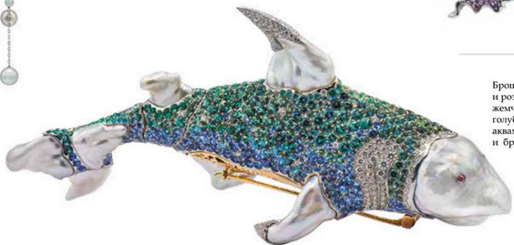
Брошь The Shark из палладия и розового золота с барочными жемчугом и жемчугом Кеша, голубыми турмалинами, аквамаринами, рубинами и бриллиантами