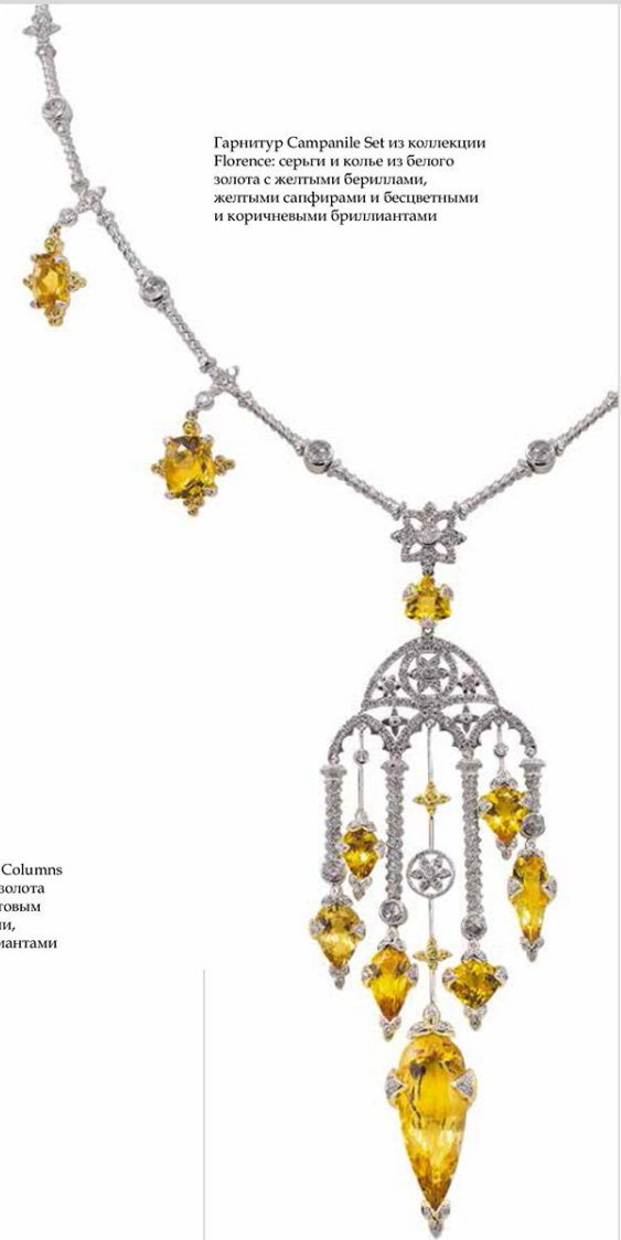
Гарнитур Campanile Set из коллекции Florence: серьги и колье из белого золота с желтыми бериллами, желтыми сапфирами и бесцветными и коричневыми бриллиантами