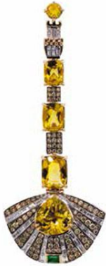
Серьги The Palio из розового и белого золота с бериллами, изумрудами, бесцветными, желтыми и коричневыми бриллиантами