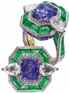
Кольцо Sand Stone Breeze из белого и желтого золота с фиолетовым сапфиром, изумрудами и цавритами, бесцветными и черными бриллиантами