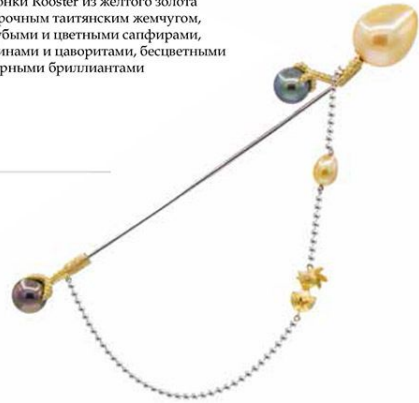
Булавка Rooster Pin из желтого и белого золота с жемчужинами Кеши Южных морей и двумя таитянскими черными жемчужинами и бриллиантами