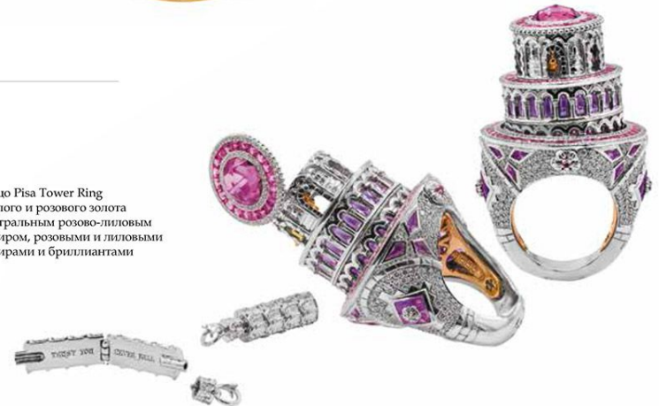
Кольцо Pisa Tower Ring из белого и розового золота с центральным розово-лиловым сапфиром, розовыми и лиловыми сапфирами и бриллиантами