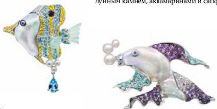
Броши Banded Butterfly Fish и Siames Fighting Fish из белого и желтого золота с жемчугом Кеша и Акойя, бриллиантами, турмалинами параиба, лунным камнем, аквамаринами и сапфирами