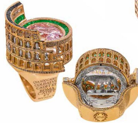
Кольцо The Nowadays Coliseum из белого и розового золота с морганитом, изумрудами и бесцветными, черными и коричневыми бриллиантами