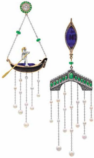
Серьги и кольцо Gondola из белого и розового золота с изумрудами, танзанитами и голубыми сапфирами, турмалином параиба, оканемелым пальмовым деревом, голубым жемчугом Акойя, бесцветными и желтыми бриллиантами