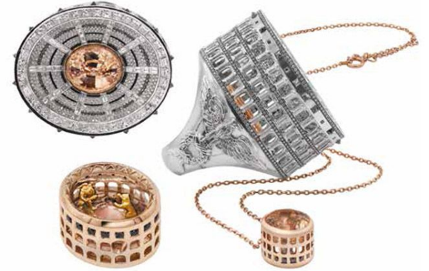
Кольцо The Empire Coliseum из белого и розового золота с сапфиром папараджа, бесцветными и черными бриллиантами