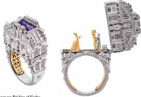
Кольцо Bridge of Sighs из белого, розового и желтого золота, с лиловой шпинелью и бесцветными бриллиантами